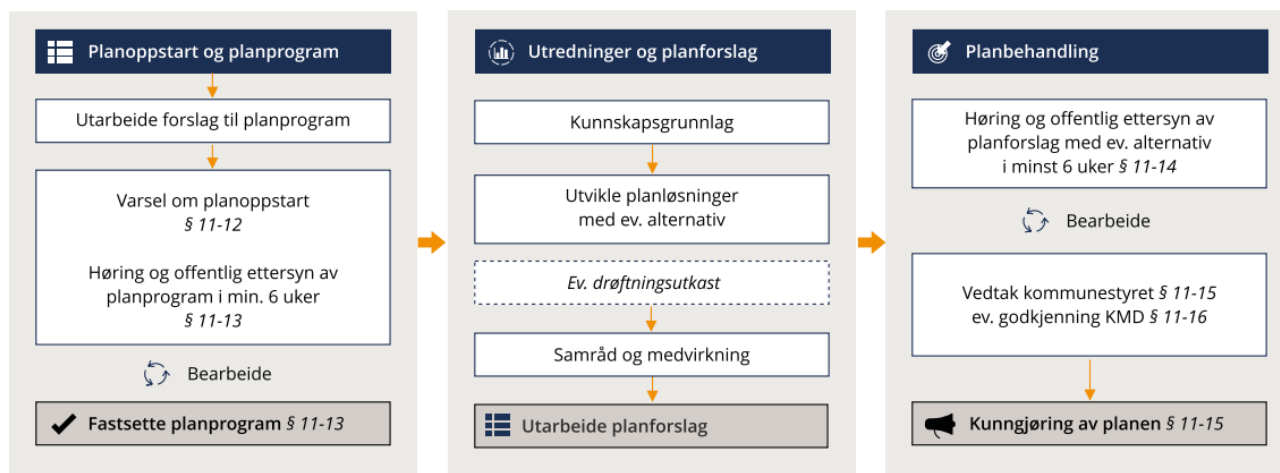
Figur 2, Hovedfasene i arbeidet med samfunnsplanen, Kilde: Veileder Kommuneplanens arealdel, KMD

Hovedfasene i arbeidet med planforslag og endelig plan vil være som følger: