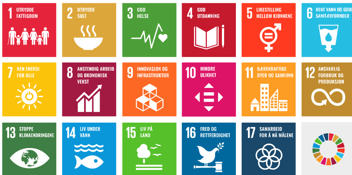
Figur 3: FNs 17 bærekraftsmål er grunnlag for kommunal planlegging. 5

I tillegg er det flere nasjonale og regionale lover og forskrifter, forventninger og planer som legger føringer for den kommunale planleggingen: